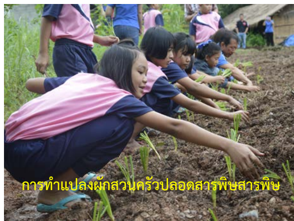
การทำแปลงผักสวนครัวปลอดสารพิษสารพิษ