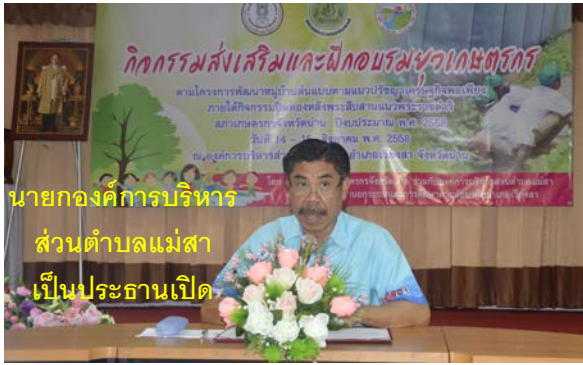
นายกองค์การบริหาร ส่วนตำบลแม่สา เป็นประธานเปิด