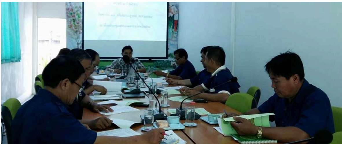
ประชุมคณะทำงานแก้ไขปัญหาการเกษตรครบวงจรสภาเกษตรกรจังหวัดน่าน ครั้งที่ ๓/๒๕๕๘ วันที่ ๑๐ กรกฎาคม ๒๕๕๘

คณะทำงานแก้ไขปัญหาการเกษตรครบวงจร สภาเกษตรกรจังหวัดน่าน มีมติที่ประชุมคณะทำงาน ครั้งที่ ๓/๒๕๕๘ วันที่ ๑๐ กรกฎาคม ๒๕๕๘ มอบหมายให้ สำนักงานสภาเกษตรกรจังหวัดน่านศึกษา รวบรวมข้อมูล ประเด็นปัญหา ๒ เรื่อง คือ ๑) ปัญหาราคาผลผลิตข้าวโพดตกต่ำในจังหวัดน่าน ๒) ปัญหาการบุกรุกป่าเพื่อทำการเกษตรในจังหวัดน่าน เพื่อเสนอเป็นแนวทางการแก้ไขปัญหาต่อสภาเกษตรกรจังหวัดน่าน พิจารณาจัดทำข้อเสนอเชิงนโยบายเสนอต่อสภาเกษตรกรแห่งชาติ