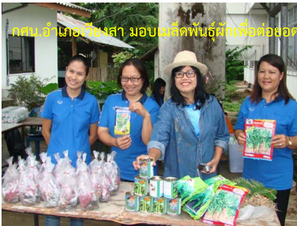
กศน.อำเภอเวียงสา มอบเมล็ดพันธุ์ผักเพื่อทดลอง